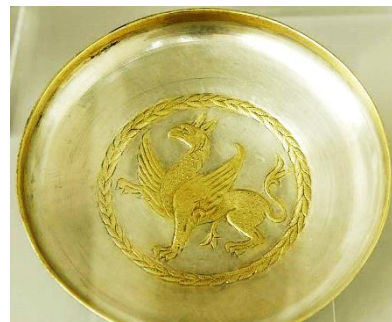
تصویر ۴- سیمای با سر عقاب، ظرف نقره، چال طهران قرن

۵-۶ میلادی.