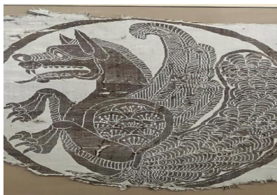
تصویر ۶- سیمرغ با سر شیر.