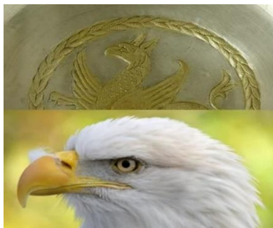
تصویر ۵- مقایسه سر سیمای با سر عقاب. منبع:

شاهنشاه ساسانی بر تخت گوهرنشانی که پایه‌های آن از دو شاهین با بال‌های باز تشکیل شده بود، می‌نشست. تاج زرین نیز از بال‌های شاهین که هلال ماه و قرص خورشید را در وسط گرفته، زینت یافته بود. شاید این نقش بیان‌کننده و رمزی از فره‌ایزدی است که قدرت و سلطنت را به وی تفویض کرده است. در وسط بشقاب بسیار ممتازی که یکی از شاهکارهای هنر ساسانی است، شاهین بزرگی با بال‌های باز نقش شده که آن‌ها پشته آب و باروری را بر سینه خود جای داده است. در اینجا عقاب جلوه‌ای از مهر است که به همراه ناهید محافظ و آورنده فره‌ایزدی است. «ترکیب انسان و پرنده در ادیان پیش از اسلام با نماد فروهر همگام است و در مرحله واسط (انتقالی) میان ادوار پیش از اسلام و اسلامی به الگوی سیمای بدل می‌شود و سپس سیمای را مؤلفانی چون هانری کربن به تصویر جبرئیل، عقل فعال و روح‌القدس تعبیر کرده‌اند» (ستاری، ۱۳۷۲: ۱۸۲). نقش عقاب یا شاهین در کل به معنای بزرگی و نشانه‌ای از الهه‌های باستانی است. با توجه به تعاریف بالا می‌توان گفت تصویرگر نقش، سیمای را چه با سر عقاب تصویر کند (تصویر ۵) چه با سر شیر (تصویر ۷) هدفی متعالی در ساخت موجودی متعالی و اسطوره‌ای با الوهیت و فره‌شاهانه در جهت تحکیم قدرت شاهانه دارد (فولادیان‌پور، ۱۳۹۹: ۱۰).