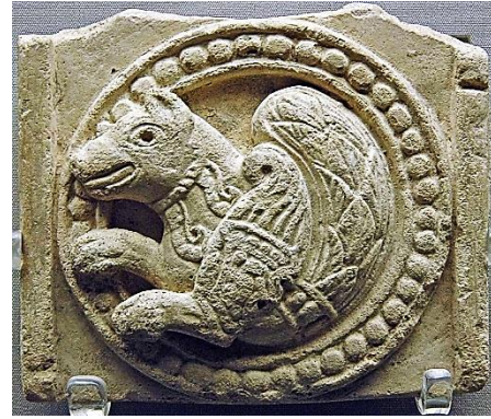
تصویر ۲- سیمای با سر خفاش گچ‌بری، چال طهران قرن