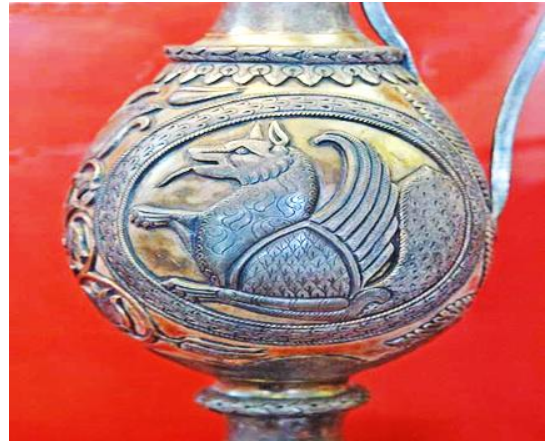
تصویر ۸- سیمرغ با دم طاووس، ظرف نقره، قرن ۶، اوایل ۷ میلادی. منبع: Museum of Islamic Art, Berlin, Inv. no.S-61

منبع: Victoria and Albert Museum, London