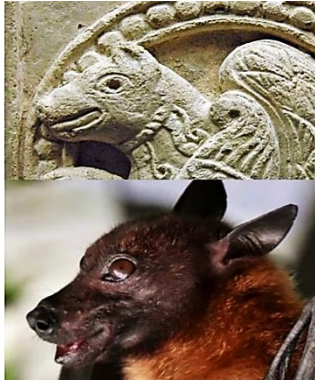
تصویر ۳- مقایسه سر سیمای با سر خفاش میوه‌خوار.