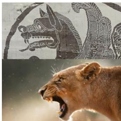
تصویر ۷- مقایسه سر سیمرغ با سر شیر.

در برخی تصاویر سیمرغ با سر شیر نقش شده است (تصویر ۶). شیر در زمان‌های گوناگون و در فرهنگ‌های گوناگون دارای تعبیر مختلفی بوده است، اما در بسیاری از فرهنگ‌ها دارای معانی مشترکی است. شیر به‌عنوان پادشاه درندگان و حیوانی پر قدرت از دیرباز مورد توجه ایرانیان بوده و اغلب نمادی از شوکت و جلال، سلطنت، قدرت و عظمت پادشاهان شناخته شده است. شیر، یکی از نمادهای مہری است که از جهات مختلف مرتبط با مهر و آیین میترا یسم یاد می‌شود و به‌عنوان نماد میترا، خورشید، آتش، ابدیت و به‌عنوان نگهبان در این آیین شناخته شده است (کوپر، ۱۳۸۰: ۲۳۵). از معناهای سمبلیک شیر می‌توان: آتش، ابهت، پارسایی، دلاوری، سلطنت، درنده‌خویی، مراقبت را نام برد. این حیوان در باورهای اساطیری نشانگر باروری زمین محسوب می‌شد. این جانور تقریباً در کلیه تمدن‌های خاور نزدیک سمبل قدرت و سلطنت به‌کار رفته و با قدرت خورشید برابری کرده است (منصوری و دادور، ۱۳۸۵: ۷۴).