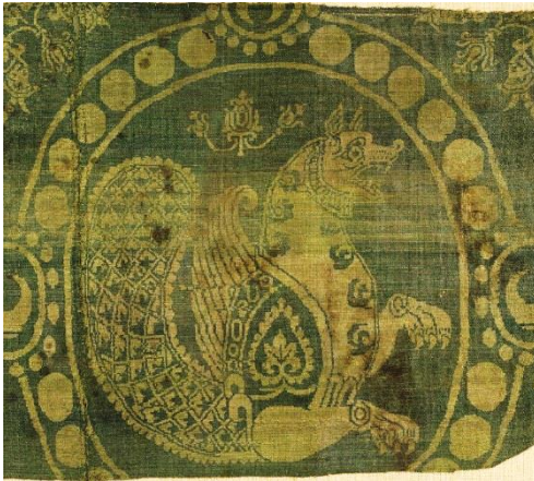
تصویر ۹- سیمرغ با دم طاووس، پارچه ساسانی، قرن ۷-۸ میلادی.