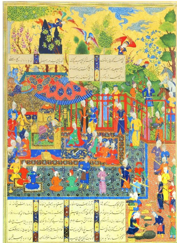
تصویر ۱. کاوه در بارگاه ضحاک، شاهنامهٔ طهماسبی، ابعاد: ۳۲/۲ در ۴۵/۵ سانتی متر، تکنیک: جوهر، طلا و نقره روی کاغذ، ۱۵۱۶ م / ۹۳۴-۱۰۲۰ ه.ق، موزهٔ متروپولیتن، نیویورک (URL 1).

در بررسی روایت‌های شاهنامهٔ فردوسی، شخصیت‌های فراوانی حضور دارند. ضدقهرمان اصلی در روایت‌های مربوط به مبارزات فرانسائی قهرمانان، دیو است که از ابتدای اشعار حضور پررنگی دارد و از جملهٔ ضدقهرمانان سرسخت و ثابت است. این ضدقهرمان در برابر تمامی قدرت‌ها مقاومت نشان داده و علاوه‌بر اینکه تسلیم نمی‌شود، با روش‌هایی در پی نابودی قهرمان داستان برمی‌آید. ضدقهرمان اصلی در اکثر موارد با صفات منفی و ناپسند معرفی می‌شود و در کنار او ضدقهرمانان‌های فرعی نیز ایفای نقش می‌کنند. شخصیت‌هایی وجود دارند که نویسنده یا شاعر را قادر می‌کند که مفاهیم اخلاقی یا کیفیت‌های روحی را در قالب عمل بیاورد. شخصیت‌های نمادین (در این نگاره دیوهای بالای بارگاه)، نماد چیزی دیگرند. کاوه در روایت ادبی و نگاره در نقش قهرمان فرعی و دیوها در نقش ضدقهرمانان نمادین ظاهر شده‌اند.