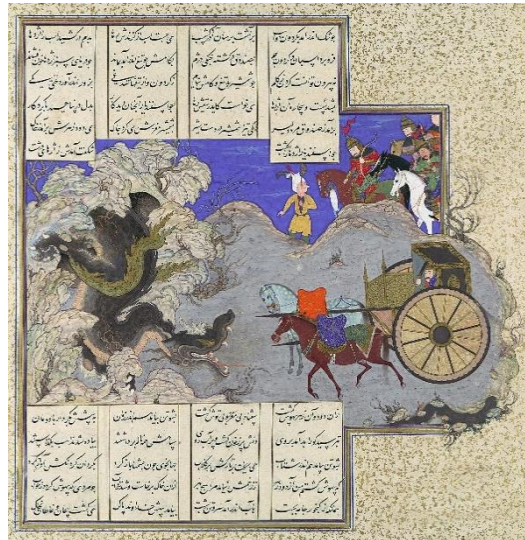
تصویر ۳. کشتن اسفندیار، ازدها راه، ۳۰-۱۵۲۵ م / ۹۳۶-۹۳۱ ه.ق، برگه ۱۲۰ ص ۷ از شاهنامه شاه طهماسب، ساینز: ۴/۷۷ سانتی متر در ۱/۳۲ سانتی متر، تکنیک: آبرنگ، جوهر، نقره و طلای مات روی کاغذ، موزه هنر متروپولیتن (URL 3).