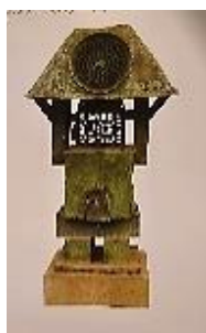
تصویر ۲- پرویز تناولی، یادمانی برای فرهاد و کوه، ۱۳۴۰ش. مس