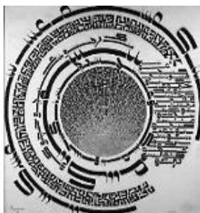
تصویر ۱- حسین زنده‌رودی بدون عنوان، ۱۳۴۳ش. رنگ‌روغن، مأخذ: کشمیرشکن، ۱۳۹۴، ۱۱۷

همان‌طور که ذکر شد، در دوره ابتدایی جنبش سقاخانه وجه مذهبی در شکل‌گیری آثار غالب است. روایت‌گری با وجه مذهبی از منظر حسین زنده‌رودی در جنبش سقاخانه گسترش یافت. به عقیده وی مفهوم «تکرار» که در خطوط خوشنویسی وی جلوه کرد، دارای یک ریشه عرفانی است؛ «شما نماز می‌خوانید و این تکرار باعث می‌شود که حواس آدم جمع بشود و بیشتر به خدا توجه کند و حرف‌هایش را بزند» (گودرزی، ۱۳۸۰: ۲۰). زنده‌رودی قصد داشت با تکیه بر وجهی که با تکرار حروف در آثارش شکل می‌داد، مخاطب را به مراقبه و آرامش دعوت کند. وی آن‌قدر به فکر نو بودن وجه تصاویرش بود که قداست سنتی خوشنویسی را به ابژه‌ای متنوع‌شده با دریافتی جدید تبدیل کرد. از وجوه دیگر آثار او می‌توان به اعداد و ارقام، طلسم‌ها و دعاها، نقش و نگارهای بومی چاپی، علائم طالع‌بینی و نجوم اشاره کرد. کانونی‌سازی در آثارش بیرونی است، زیرا وجه آثار، محدود به یک زمان و مکان خاص نیست و روایت فاقد شخصیت است. اگر تصاویر دارای شخصیت مستقیم باشند، سطوح روایت در دل تصویر شکل می‌گیرد. زنده‌رودی از شخصیت‌های غیرمستقیم در آثارش بهره برده است؛ همانند بافت‌های حروف که با حرکت موجی که در تصویر به راه انداخته است، لحن تصویر را گاهی به سمت رقصی پویا و گاهی به سمت یک مراقبه پیش برده است؛ بنابراین جهت‌گیری، بیرون داستان است و مخاطبین از تصویر برداشت آزاد و متفاوتی دارند.