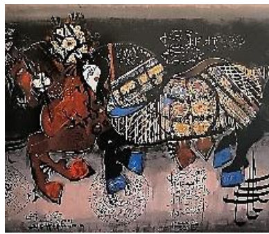
تصویر ۵- ناصر اویسی، رخس، آکرلیک، ۱۳۴۴ش، مأخذ: tehranauction.com (2021/09/15)