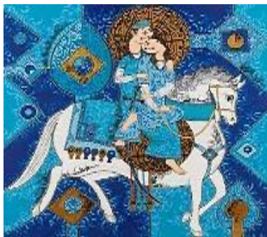
تصویر ۴- صادق تبریزی، دودلداده، ۱۳۵۶ش، رنگ‌وروغن. مأخذ: کشمیرشکن، ۱۳۷، ۱۳۹۴.

مینیا توری، ماه پیشونی‌ها و دختران گیس‌گلابتون، زوج‌های تغزلی و سوارکاران و علامت‌های عاشورایی همچون پنجه ابوالفضل روایت می‌کند. کانونی‌سازی در درون متن تصویر اتفاق افتاده چراکه در آثار تبریزی، روایت‌گری شخصیت‌ها صورت گرفته است. لحن روایت‌گری تصاویرش شامل: قطعات تزئینی زنجیر، نگین، مهره‌های آبی، کلیدها و قفل‌های قدیمی، کاسه‌های فلزی با لبه‌های حکاکی‌شده، یا تکه‌هایی از سنگ‌های نیمه‌قیمتی و مزین شده است. می‌توان گفت، وجه آثار تبریزی (تصویر ۴)، با صدای روایت‌مندی لحن، هم‌زمانی دارد. آوای تناژ آبی در اثر تبریزی، حاکی از رنگ مهره‌های چشم‌زخم دارد که در دیگر آثار تبریزی به‌طور مستقیم از آن استفاده شده است. وجوه هندسی که در سطوح روایت‌گری از آن استفاده کرده است تداعی‌کننده نقوش منسوجات ایرانی است. تبریزی با درکی که نسبت به فضای تصویر دارد، با درایت کامل به چکیده‌نگاری (ساده‌کردن اشکال طبیعی به اشکال هندسی و آرگانیک)، نقوش گلیم و قالی ایرانی پرداخته است. این ساده‌سازی منجر به هم‌زمانی و نزدیکی وجه و لحن شده است و صدای تصویر با زاویه روایت‌گری آن هم‌خوانی دارد. وجه آثار صادق تبریزی و ناصر اویسی (تصویر ۵)، براساس منظرهایی که در روایت‌گری به‌کار می‌برند، مشابه است؛ اما آنچه آثار تبریزی را از اویسی متمایز می‌کند، چیدمان منظرهایی است که کانونی‌سازی درونی را شکل داده است. این کانونی‌سازی در آثار اویسی زمینی و مادی است؛ و در آثار تبریزی بُعد عارفانه و معنوی دارد. نقاش به‌عنوان راوی، از کانونی‌سازی در