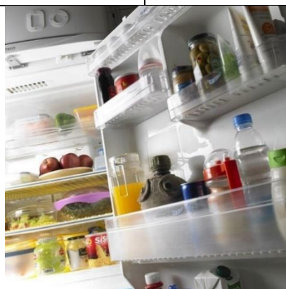
تصویر (۱۰): مجموعه هیچ،هیچ، اثر شادی قدیریان، سال تولید اثر: ۱۳۸۶