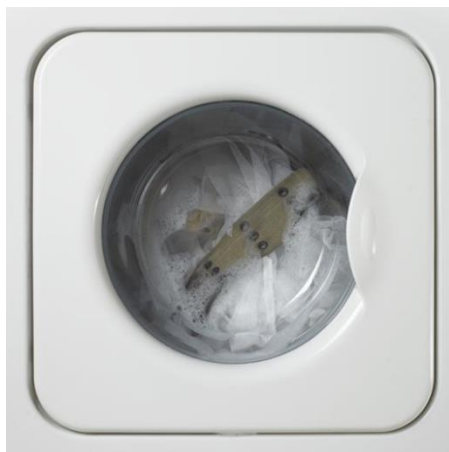
تصویر (۳): مجموعه هیچ، هیچ، اثر شادی قدیریان، سال تولید اثر: ۱۳۸۶