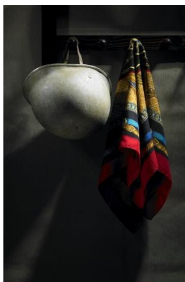
تصویر(۶): مجموعه هیچ،هیچ،هیچ، اثر شادی قدیریان، سال تولید اثر: ۱۳۸۶