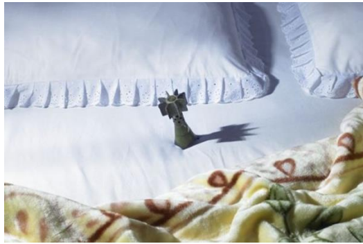
تصویر (۸): مجموعه هیچ،هیچ، اثر شادی قدیریان، سال تولید اثر: ۱۳۸۶