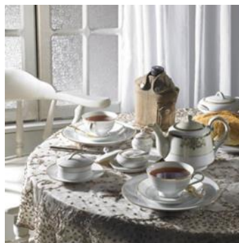
تصویر (۱): مجموعه‌ی هیچ، هیچ، اثر شادی قدیریان، سال تولید اثر: ۱۳۸۶