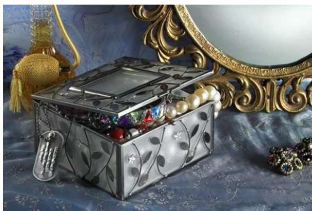
تصویر (۹): مجموعه هیچ،هیچ، اثر شادی قدیریان، سال تولید اثر: ۱۳۸۶