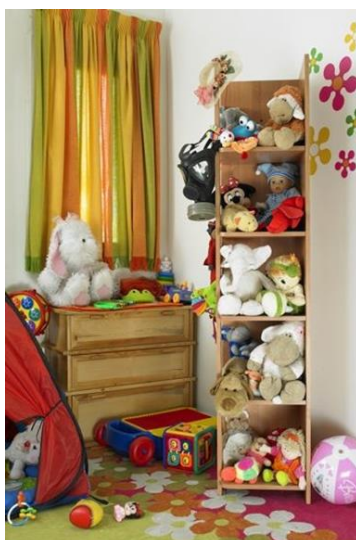
تصویر (۴): مجموعه هیچ، هیچ، اثر شادی قدیریان، سال تولید اثر: ۱۳۸۶