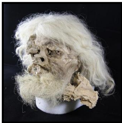
تصویر ۵- مرد نمکی شماره یک. موزه ملی