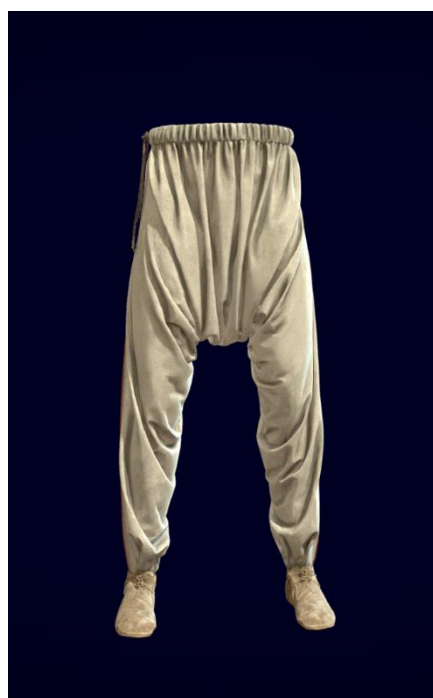
تصویر ۷- بازسازی دیجیتال سه‌بعدی کامل از پوشاک مرد نمکی شماره ۴ (۴۰۵-۳۸۰ قبل از میلاد)