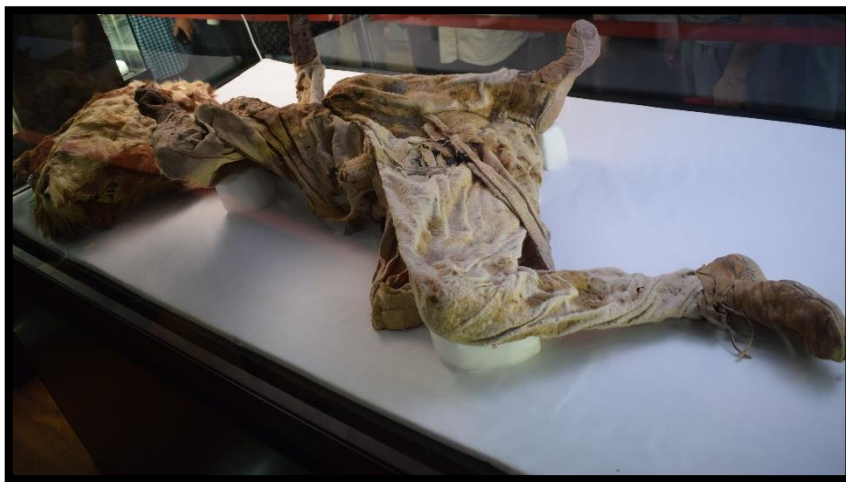
تصویر ۶- مرد نمکی شماره چهار (نویسندگان)