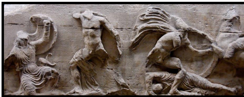
تصویر ۳- یونان، آکروپولیس، معبد آتنا نیکه. جنگ سربازان اسکندر با سربازان ایرانی